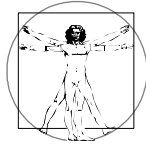
Sistema: BIOLÓGICO Único Propósito: Sobrevivir